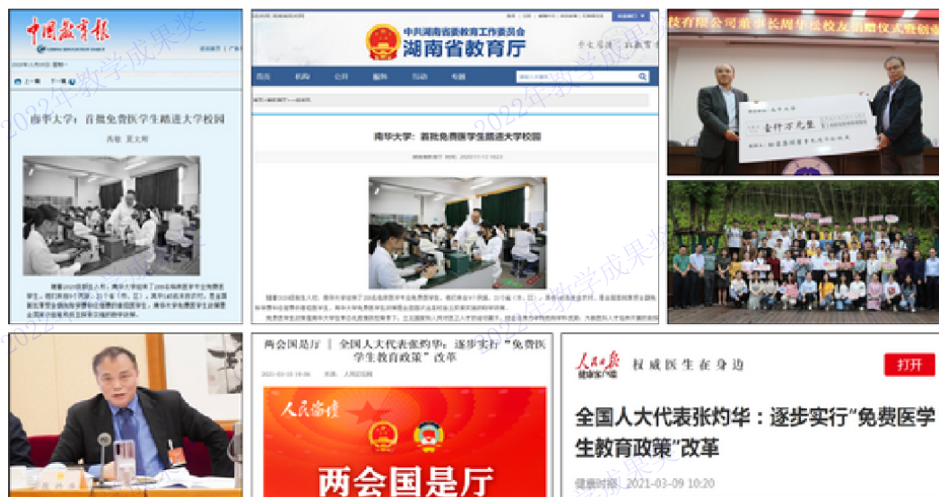
图2 国内首创免费医学生计划

建立“实战”育人机制，培养执医为民情怀。投入 2 亿元，建设国家级重大疫情救治基地和“大思政课”实践基地，建设以“精准扶贫”首倡地十八洞村为代表的新农村卫生实践教学基地，让学生在基地实践中厚植为民情怀。