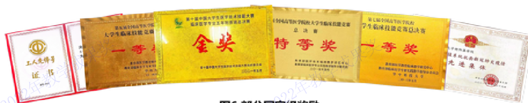
图6 部分国家级奖励

获得全国大学生医学技术技能大赛 特等奖、金奖和一等奖总数排名全国第 5。麦可思调查显示，近两年南华大学医学生临床基本能力、批判思维能力、职业素养等增值比例分别达到 94%、90% 和 95%。新冠疫情期间近 3000 名医学生主动请战，体现了责任与担当。涌现了中国大学生自强之星、国家奖学金和国家励志奖学金获得者、湖南省首届最美大学生等先进典型近 2000 人次。